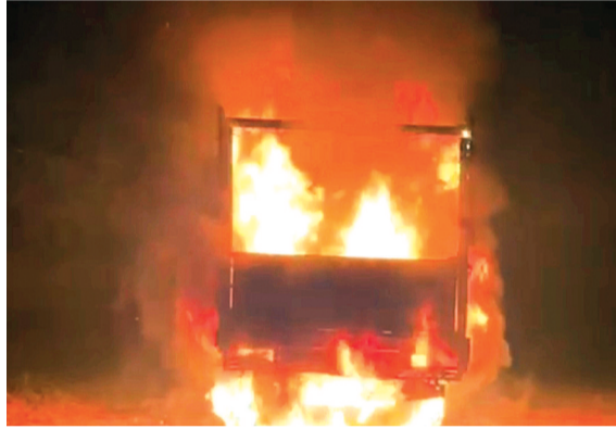
वाहन को ग्रामीणों ने किया आग के हवाले

बताया जा रहा है कि पिकअप वाहन में दो गायें बंधी हुई थीं। जैसे ही ग्रामीणों ने वाहन को घेरा, चालक अंधेरे का फायदा उठाकर मौके से फरार हो गया। ग्रामीणों ने तुरंत गायों को वाहन से बाहर निकाला।